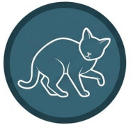
Posturas corporales asimétricas