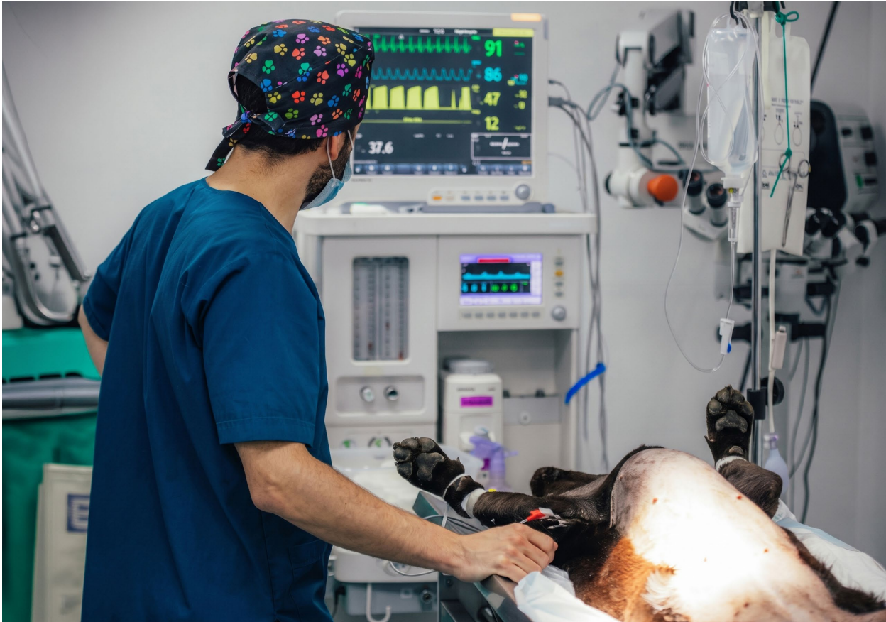
Valoración preanestésica: la clave para una anestesia veterinaria más segura

La valoración preanestésica constituye uno de los pilares fundamentales de la medicina anestésica veterinaria, ya que permite disminuir significativamente la morbimortalidad asociada a los procedimientos anestésicos. Diversos estudios han demostrado que gran parte de las complicaciones durante la anestesia pueden prevenirse mediante una adecuada evaluación clínica, la estabilización fisiológica del paciente y la selección individualizada del protocolo anestésico.