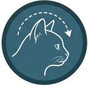
Rotación de las orejas hacia atrás