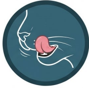
Actividades orales como lamido de labios