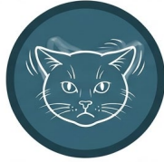
Sacudidas de cabeza